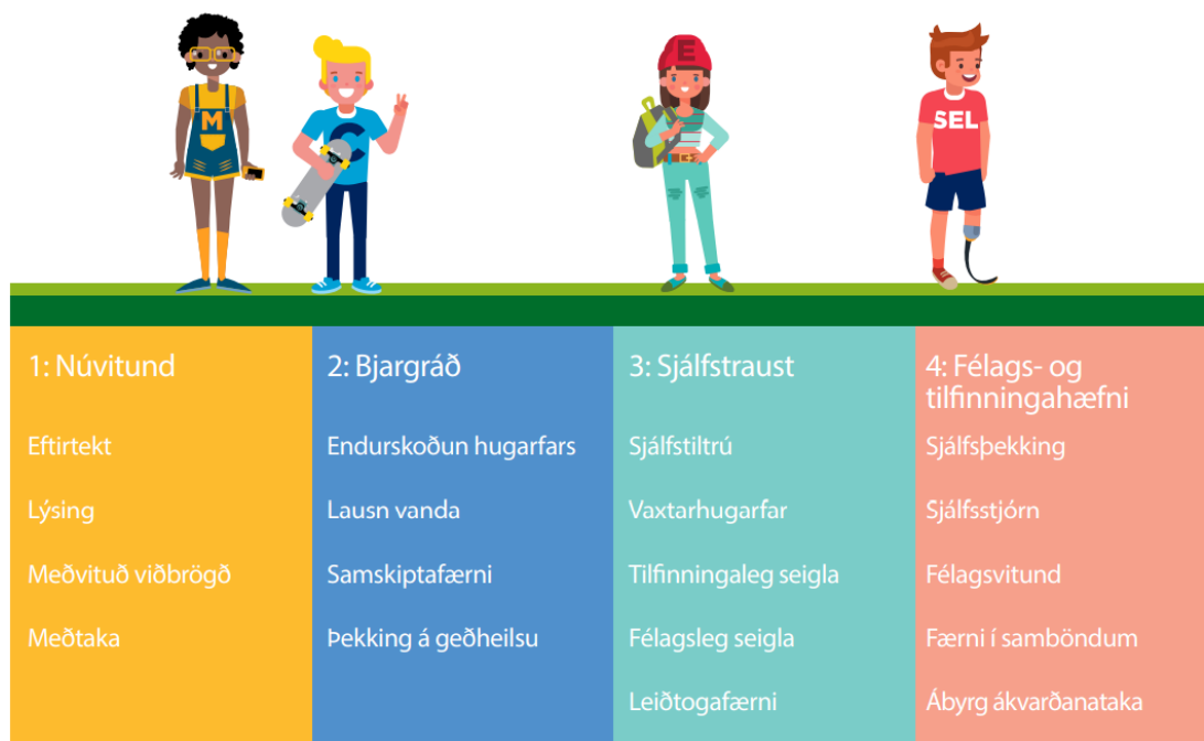
Mynd 2. VELLÍÐAN FYRIR OKKUR námsefnið samanstendur af 4 hæfniþáttum og 18 færniþáttum

UPRIGHT hugtakaramminn samanstendur af fjórum mismunandi þáttum: Núvitun, bjargráðum, sjálfstraust og félags og tilfinningahæfni. Færniþættirnir eru 18.